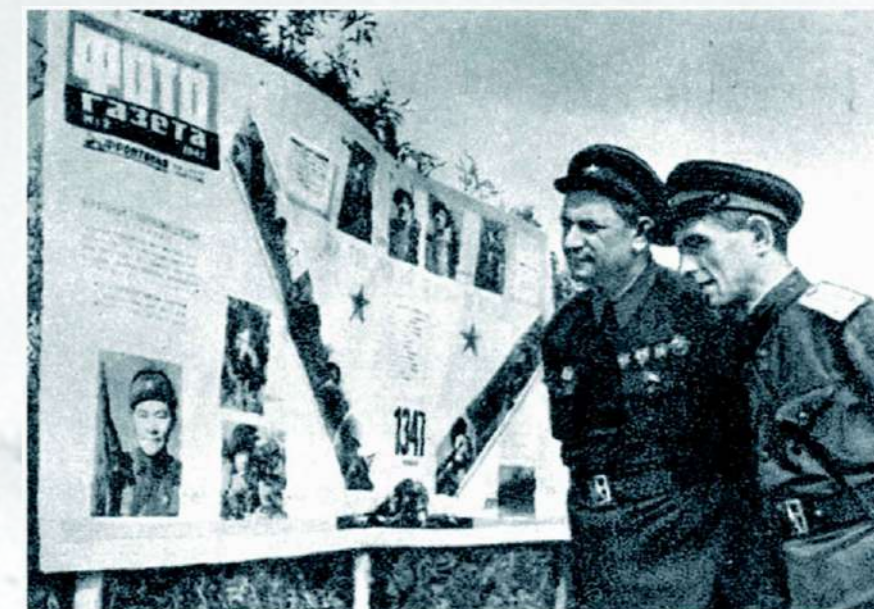
Писатель В. П. Ставский (слева) у фотогазеты, посвященной знатным снайперам