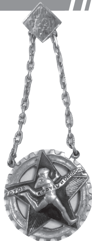
Номерной знак ГТО из фонда Тихорецкого историко-краеведческого музея. Начало 1930-х гг.