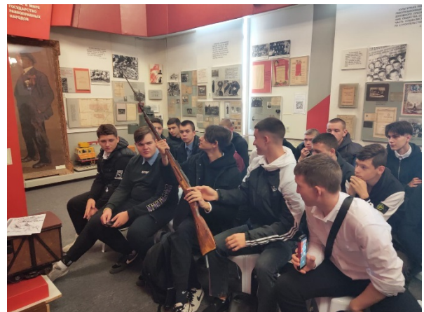
Студенты на музейной лекции об истории Гражданской войны в России.