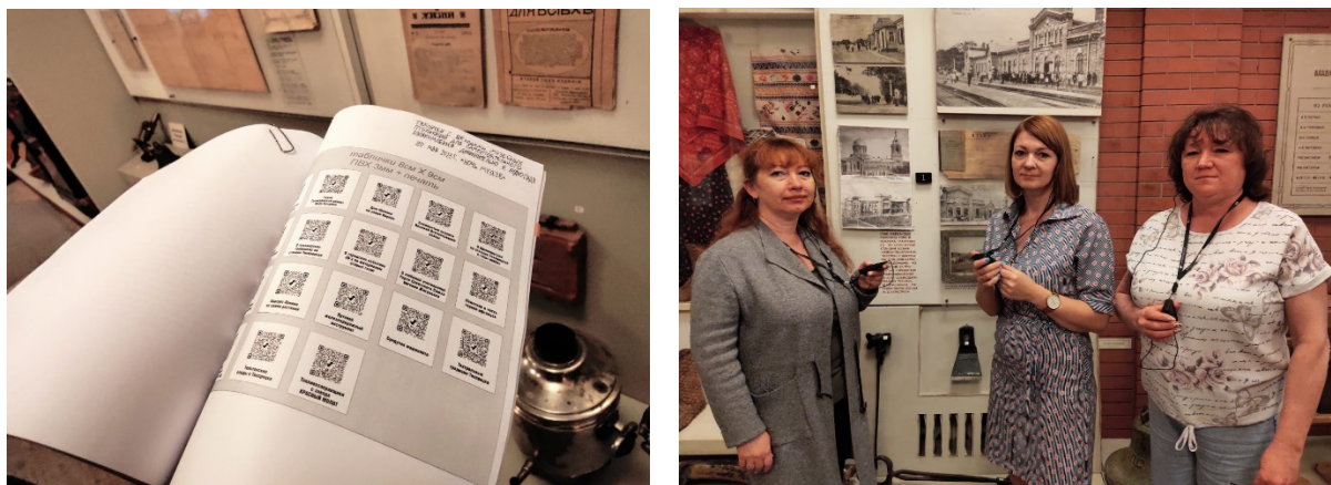
Сотрудники музея устанавливают электронные метки для системы музейного аудиогuida и QR коды для самых любознательных юных посетителей музея.

В рамках сотрудничества с Тихорецким районным советом ветеранов музей принял участие в подготовке и проведении двух научно – практических конференциях для учащихся общеобразовательных учреждений, участвовал в совместных патриотических уроках в школах.