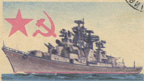
БОЛЬШОЙ ПРОТИВОЛОДОЧНЫЙ КОРАБЛЬ

Куда Краснодарский край г. Тихорецк Исторический музей Кому Азекун Р. #