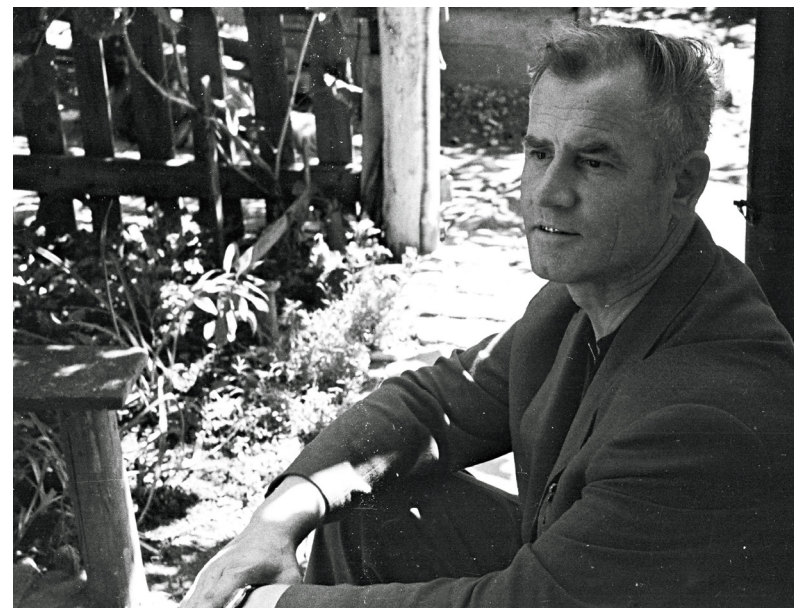
✍ Захар Сорокин во время посещения Тихорецка в 60-е годы.

Многие авиаторы стали Героями Советского Союза. Они не только совершили военный подвиг, но и одержали победу души над телом.