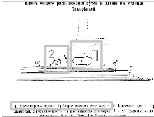
1) Пассажирское здание. 2) Старое пассажирское здание. 3) Видовое здание. 4) Дамповая. 5) Отхожее место. 6) Пассажирская платформа. 7 и 8) Промежуточные платформы. 9 и 18) Путь. 19) Павильон лавочка.

Происшествие с погромом полицейского участка вполне закономерно получило политическую окраску в запрещенной печати, в частности в издании революционно-социалистической группы «Свобода» от 1902 года. Думается, авторы очерка о тихорецком погроме преследовали свои