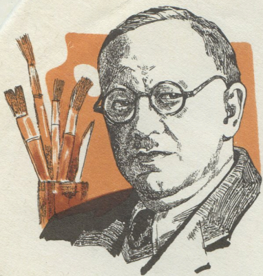
НАРОДНЫЙ ХУДОЖНИК РСФСР П. П. КОНЧАЛОВСКИЙ 1876—1956