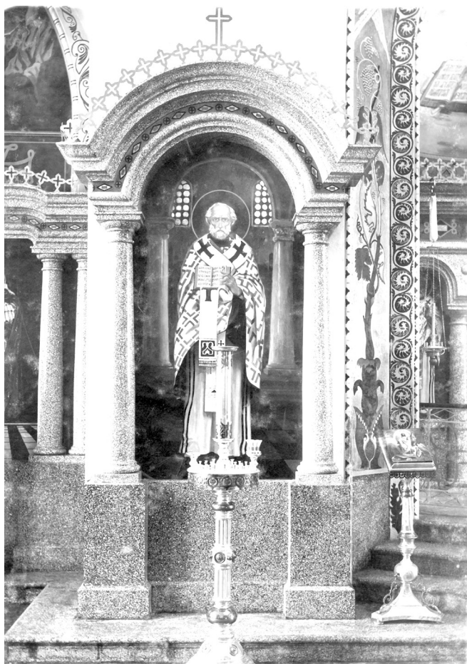
Образ св. Николая Чудотворца в Николаевском храме (до революции).

В апреле 1887 г. служащие станции приобрели новую икону – святителя Николая Чудотворца. На её покупку шли средства, полученные служащими от продажи восковых свечей при прежней иконе. Это впоследствии стало решающим обстоятельством в возникшем споре между причтом стационной Николаевской церкви (освящена в 1896 году) и служащими станции.