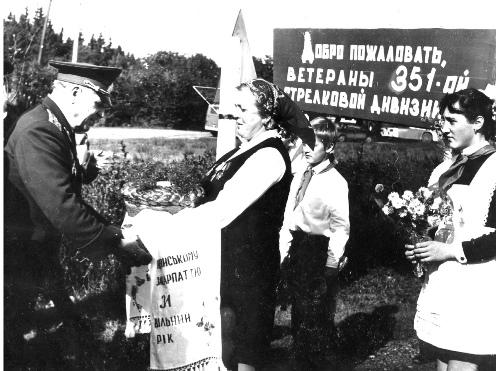
Встреча ветеранов Великой Отечественной войны. Ужгород, 27 октября 1975 года.

Сканируйте QR-код и смотрите фотоальбом на сайте Тихорецкого историко-краеведческого музея.