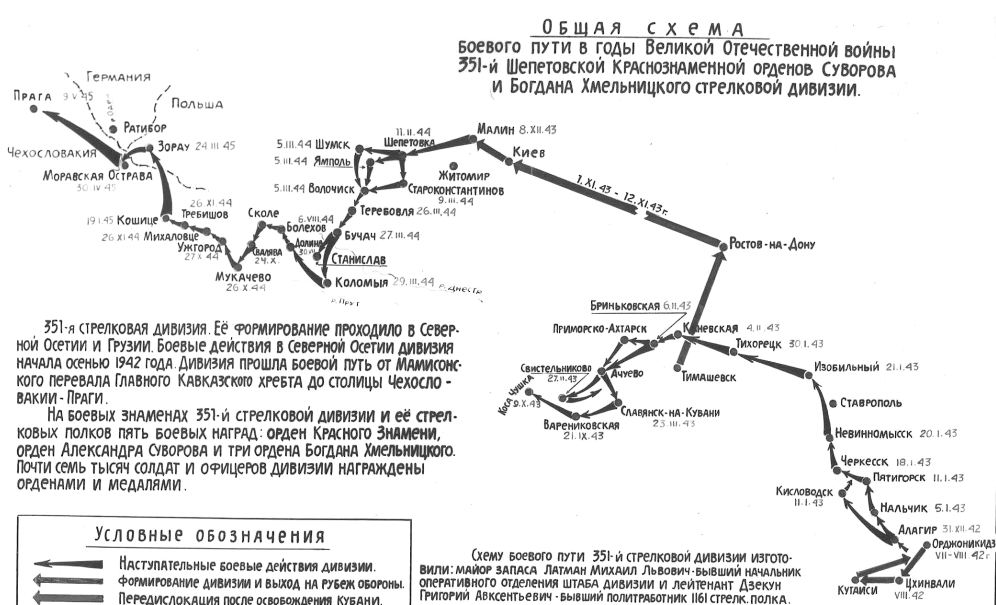
Боевой путь 351-й стрелковой дивизии.