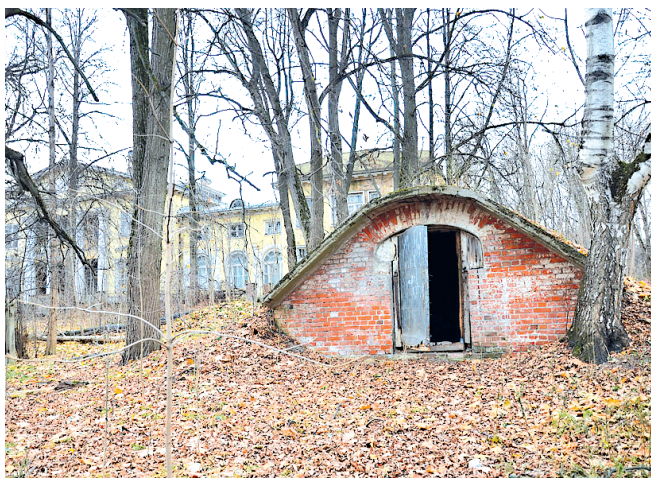
▲ Таким запечатлел усадьбу с очень понравившимся ему старинным погребком автор публикации.