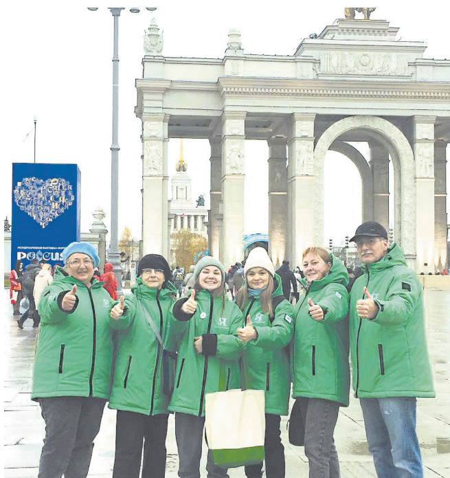
▲ Всех гидов на международной выставке «Россия» объединяет увлечение историей.

Все сложные организационные вопросы решаются оперативно и даже с какой-то легкостью, а ведь ежедневно на ВДНХ проводится бо-