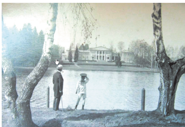
▲ Старинное фото усадьбы Виноградово из сети Интернет.

Первые документальные данные об усадьбе относятся к 1623 году, когда посе-