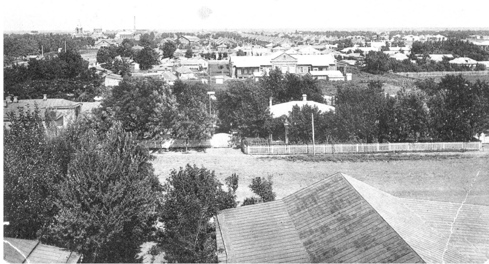
Почтовая открытка № 6 из серии «Привет со ст. Тихорецкая».