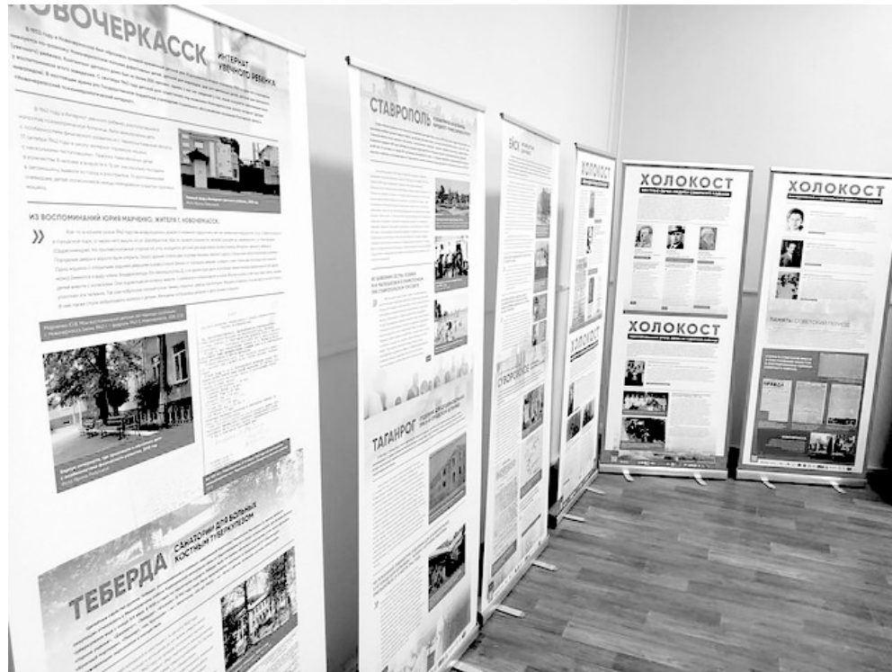
Выставка «Помни о нас» в стенах Тихорецкого историко-краеведческого музея.