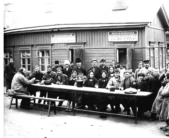
Переселенческая столовая.