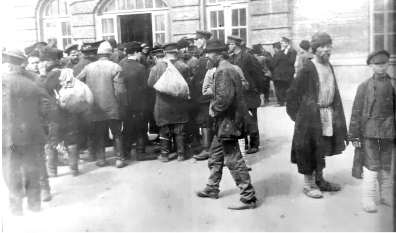
Переселенцы в ожидании работы.

Для учета переселенческого движения была организована регистрация ходоков и рабочих. Запись людей производилась особо пригла-